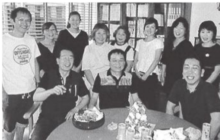
参加者全員での食事風景