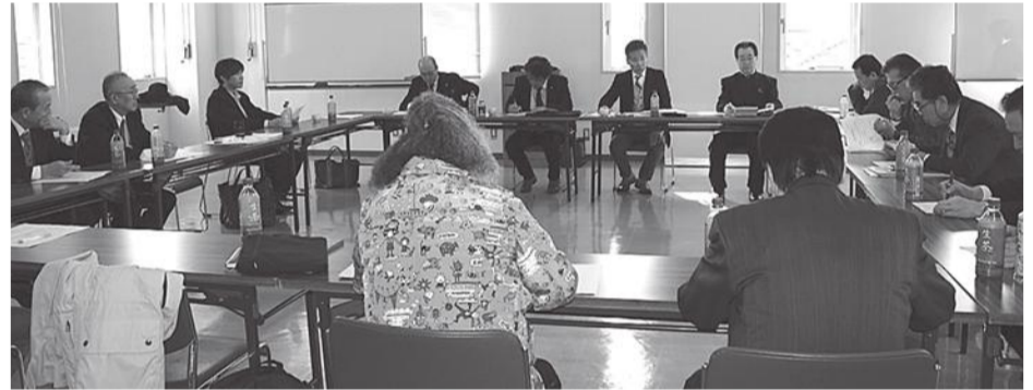
●会議出席理事の皆様

手セイエイ百貨店開所式が“ゆうあいの里”であり、今後は料金をいたたく形に。新聞・テレビ等で報道されたと話された。