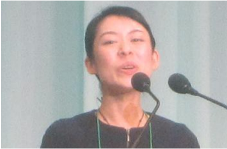
熱のこもった発表