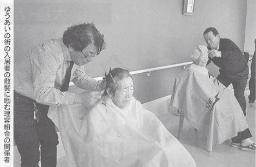
ゆづあいの街の入居者の散髪に協賛する組合の関係者