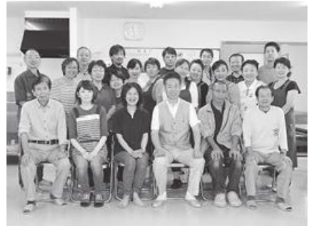
出席者全員で記念撮影