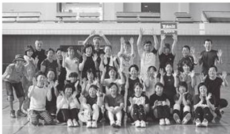
出席者全員で記念撮影