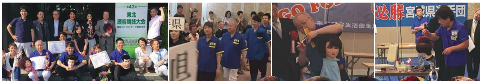
各賞受賞の選手と応援団の皆さん

第43回東北理容競技大会が津軽南田温泉ホテルアップランドで盛大に開催されました。