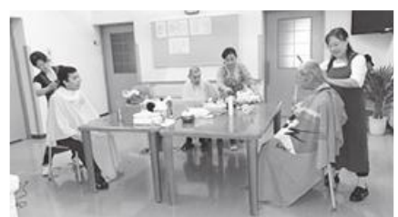
気持ちよくカットされる入居者の皆さん

『理容店へ行くのが困難な利用者さんも多く、毎年足を運んで頂き感謝しております』と御言葉を頂きました。