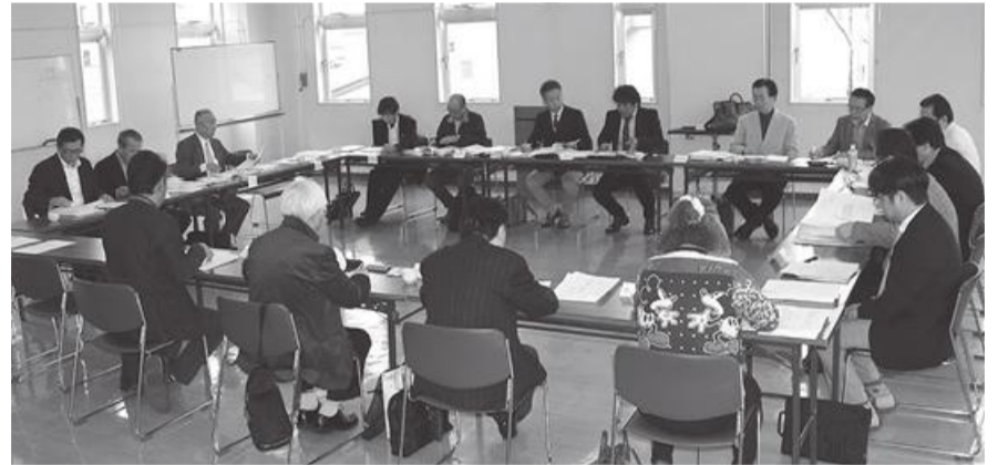
○議論し合う理事のみなさん