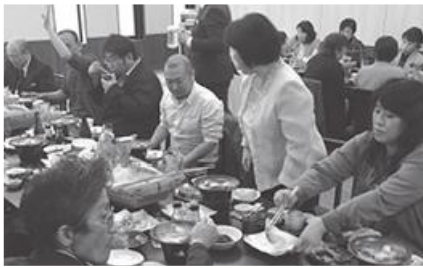
参加者全員での食事風景

去る平成29年5月15日(月)当支部日帰りバス総会を行い、日頃の疲れを癒して来ました。