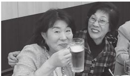
懇親会でお酒を楽しむ組合員のみなさま