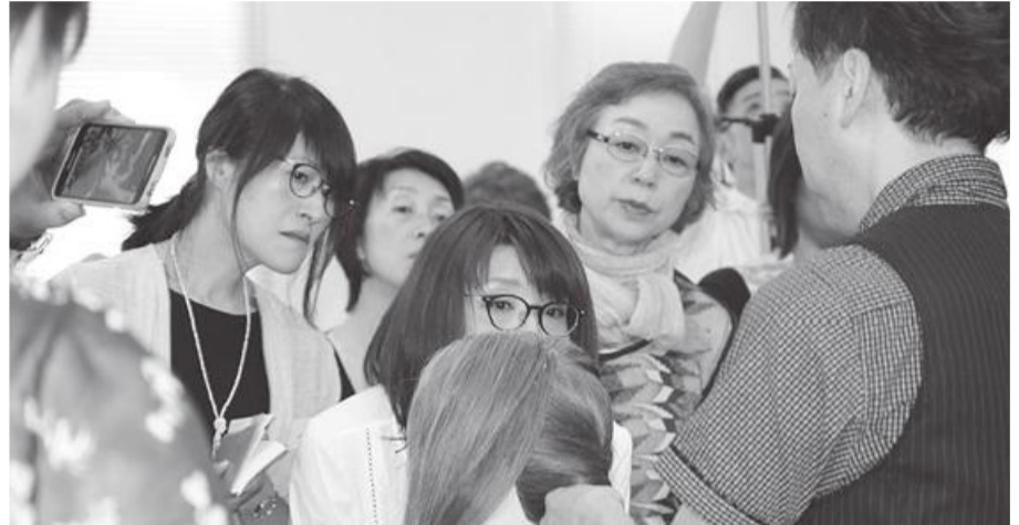
●熱心に技術を受講するみなさん

新聞には、店販などを1割程度に抑さえ店側の個人的な出来事、休日などお店のお知らせ、心理テスト、4コマ漫画、健康情報、スタッフ紹介などを書いて、スタッフなどの個人情報を知って貰うとお客様の安心感が生れると話された。