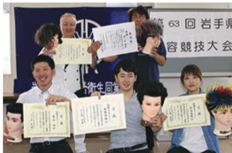
出席者全員で記念撮影