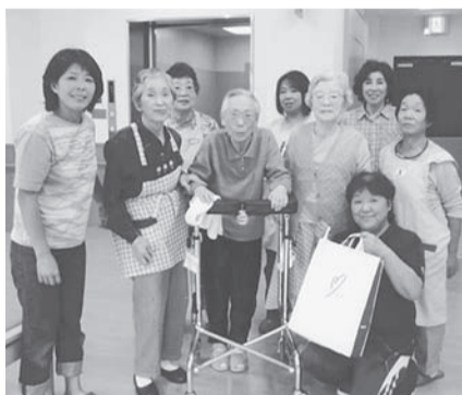
▲(五葉寮)施設責任者&さわやかな気分の入居者

この日は、隣接する老人福祉施設(三峯の杜)と2か所に少しばかりの気持ち(入居者に飲料)をお届けした事をご報告し、合わせて理容ボランティア活動と致します。