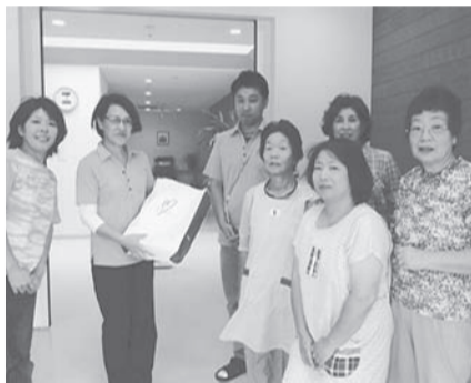
▲(三峯の杜)施設責任者と

今年の「理容ボランティアの日」であった9月14日、山田支部でも町内の老人介護施設にて理容ボランティアを行いました。