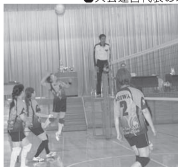
▲繋いだボールを打ち返す紫波支部の選手