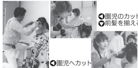
●園児のカット ●前髪を揃える

後継者育成が叫ばれる中、理容師のすばらしさを伝えられたことがよかったです。しかしながら問題点として、保育園児だけでなく、中高生にも伝えられればと思ったことも事実です。