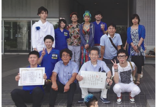
●出場選手と理事長、応援の皆さん

応援された皆さん、本当にご苦労様でした。さて来年はいよいよ岩手県での開催が予定されていますが、講師会としても大会運営に大きく係わりをもつことになり、今回の大会は来年に向けた視察も兼ねたものとなった。