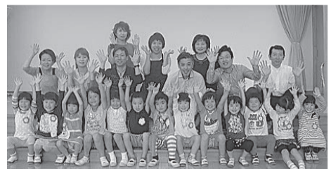
▲紫波支部の皆さん