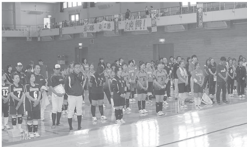
▲開会式に出るバレーボール選手の皆さん

く、勝ち進んだ各支部の選手からは後日再試合を要望されましたが、当日の試合すべてノーゲームという事になり、前年優勝チーム一関・東磐井支部混成チームが今年の理容東北野球大会の代表決定。