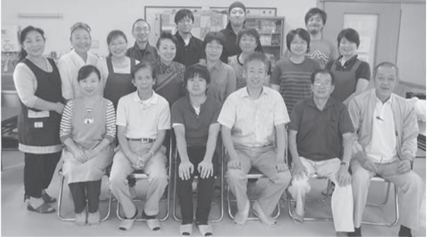
きれいさっぱり♪北上支部の皆さん