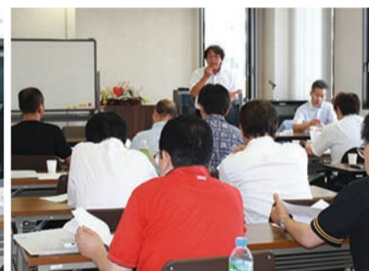
▲理事長より説明を聞く理事の方々