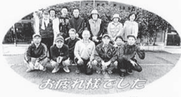
盛岡支部の皆さん 9月14日(月)

9月14日(月)北上支部では、市内の障がい者支援施設『萩の江』に支部員18人が訪問し、同施設利用者62人を対象に、また沢内地区でも特別養護老人ホーム『ぶなの園』にて「カットボランティア」を実施予定ですが、施設の都合で延期になっています。