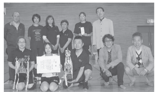
▲大会初優勝の雫石支部