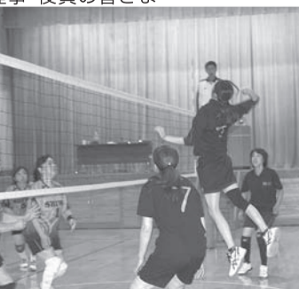
▲力強いスパイクを打ち込む雫石支部の選手