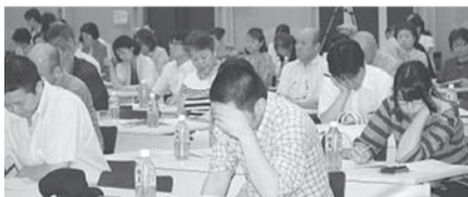
◎セミナー参加の組合員