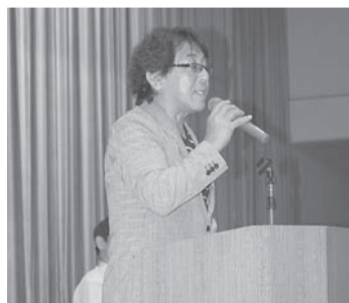
▲湊理事長より大会開催あいさつ