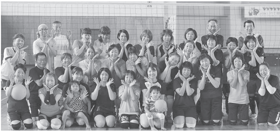
●親睦バレー後の参加者の皆さん

紫波支部では7月6日(月)に紫波町総合体育館で、近隣支部同士ソフトバレー交流会を開催し親睦を深めた。