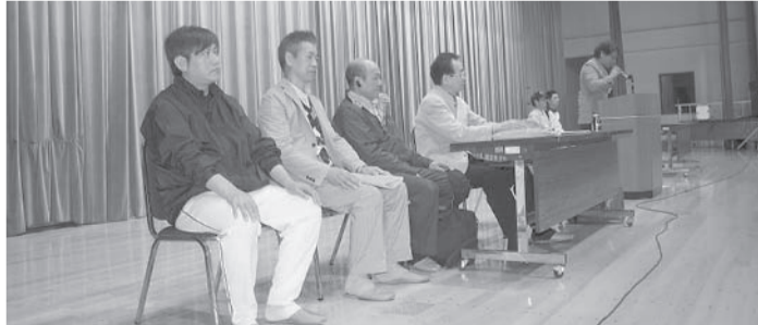
▲大会運営代表の理事・役員の皆さま