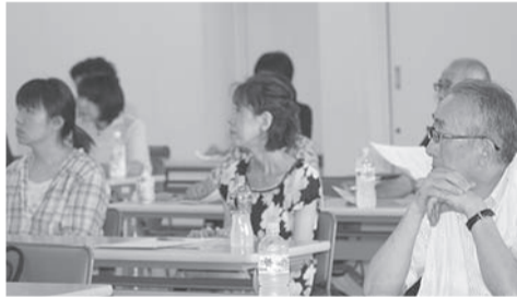
◎真剣に話を聞き入る組合員