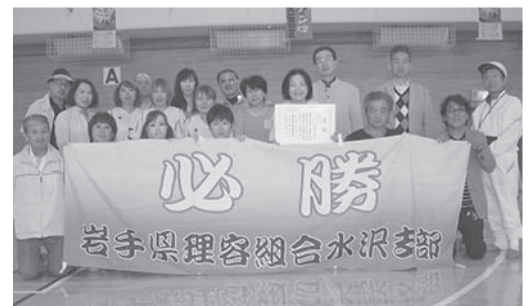
▲3位健闘の水沢支部