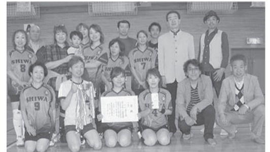
▲惜しくも準優勝の紫波支部