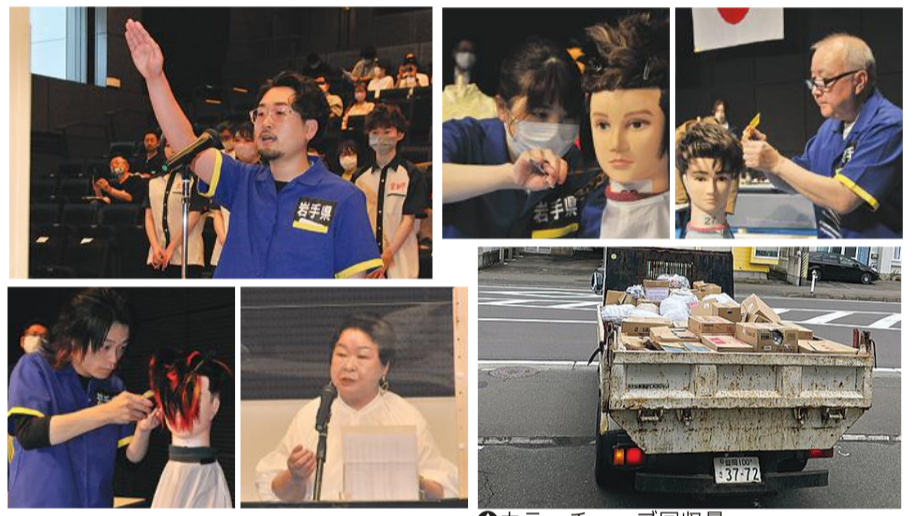
カラーチューブ回収量

大会役員、前日から会場設営で集まりお手伝いで参加いただいたボランティアの方々、当日参加組合員、応援に来られた関係各位に心から感謝を申し上げます。大変お疲れ様でした。