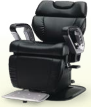
INOVA-EX イノヴァEX 月々 8,200円~