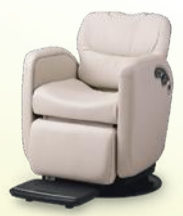
LUAR ルアール 月々 10,800円~