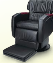
Divan ディヴァン 月々 14,100円~

POINT 1 初期投資額を抑えられる! 毎月一定の料金のお支払いなので、初期投資額を抑えることが出来ます。