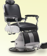
Classica 90E クラシカ 90E 月々 8,900円~