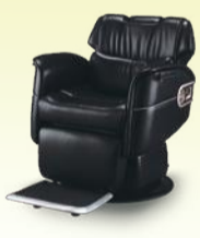
MARVEL マーベル 月々 13,600円~