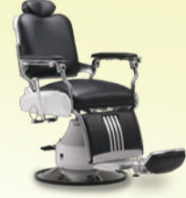
Classica 90E クラシカ 90E 月々 8,900円~