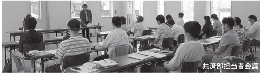
共済部担当者会議