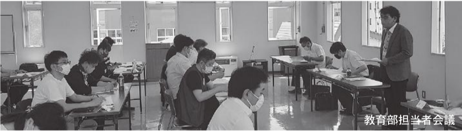
教育部担当者会議

令和3年6月14日(月)理容会館において教育部、6月28日(月)同場所にて令和3年度共済部担当者会議を開催。