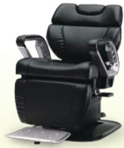
INOVA-EX イノヴァEX 月々 8,200円~