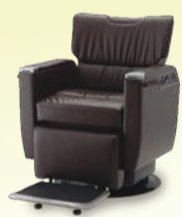
BRAMU ブラム 月々 11,400円~