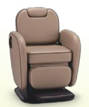
macaron マカロン 月々 8,200円~