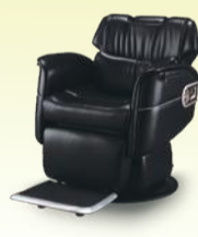
MARVEL マーベル 月々 13,600円~