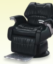
LEGEND II レジェンドII 月々 10,600円~