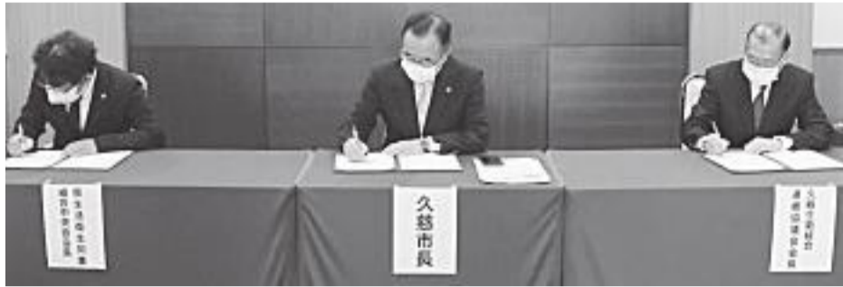
10月29日久慈市久慈グランドホテルに於いて、岩手県生活衛生同業組合中央会、久慈地区生活衛生同業連絡協議会と久慈市が高齢者らの生活

支援に関する包括連携協定を結んだ。三者が協力し、社会福祉施設への出前サービスなどで地域包括ケアの充実につなげる。