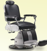
Classica 90E クラシカ 90E 月々 8,900円～