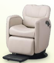
LUAR ルアール 月々 10,800円~