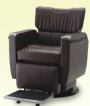
BRAMU ブラム 月々 11,100円~