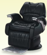
LEGEND II レジェンドII 月々 10,300円~