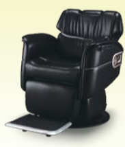
MARVEL マーヴェル 月々 13,100円~