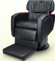
Divan ディヴァン 月々 13,700円~

POINT 1 初期投資額を抑えられる! 毎月一定の料金のお支払いなので、初期投資額を抑えることが出来ます。