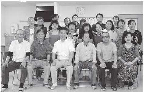
◎出席者全員で記念撮影