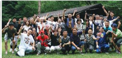
▲野球大会終了後のバーベキュー

くつろぎの宿で、やすらぎのひとときを ~心つくしたおもてなし~ 平成30年度全理連指定旅館友の会 会員旅館・ホテル一覧 平成30年4月1日現在