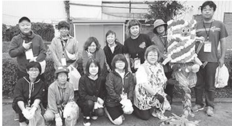
◎出席者全員で記念撮影