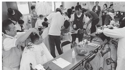
◎気持ちよくカットされる入居者の皆さん

この活動は今年で10回目となります。地域の社会貢献の一環として今後も引き継いで行きたいと思ひます。