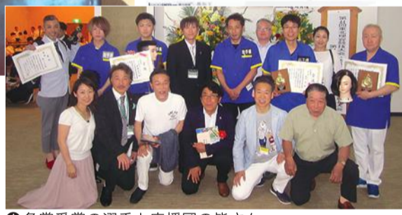
各賞受賞の選手と応援団の皆さん

大会・理容2018メッセージ全国大会に向け、更なる高みを目指して、頑張ってください。ご指導と応援に来られた