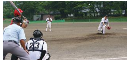
▲試合中の選手のみなさん