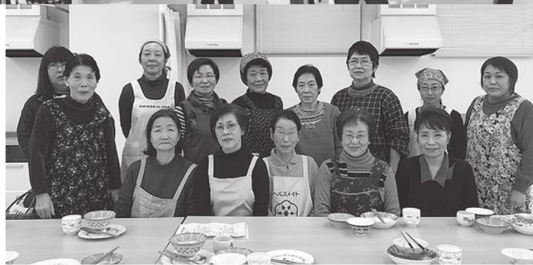
出席者全員で記念撮影