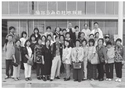
◎参加者全員で記念撮影

帰りは“仙台杜の市場”でお土産を沢山買って、その後の車内はちょっとお疲れモード。でも最後は必ず“星影のワルツ”を全員合唱でお別れです。お疲れ様!皆さん、ご協力ありがとうございました。