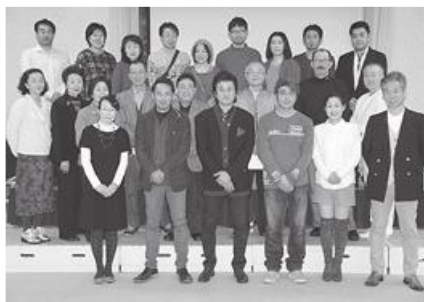
◎出席者全員で記念撮影