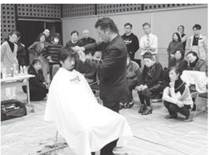
◎真剣な眼差しで受講する皆さん