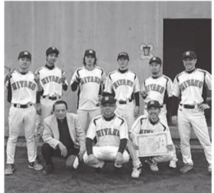
準優勝に輝いた宮古・山田・釜石連合チーム