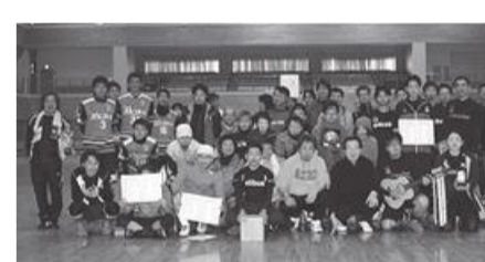
参加選手の皆さん

試合中に筋を伸ばして医学療法師からマッサージをしていただく選手もおりましたが、入院、通院になるケガ人も出ず楽しいリクリエーションになった。