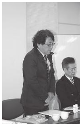
◎ 答弁する 漢理事長

PRなどをして利用を高めていく、2階理事室も他の業種に貸し出す努力をする。今すぐ会館を取り壊す事はしない。 ・来年のグラウンドゴルフ大会の開