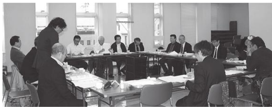
○会議出席理事の皆様