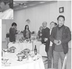
支部忘年会の様子