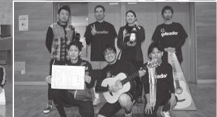
1位:岩手・雫石・盛岡支部合同チーム(セクシーバリカズ)