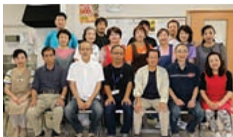
北上支部の皆さん