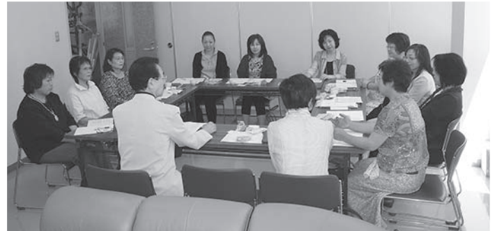
新しい各女性部長による女性部長会議