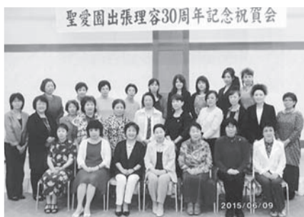
▲出席者全員で記念撮影