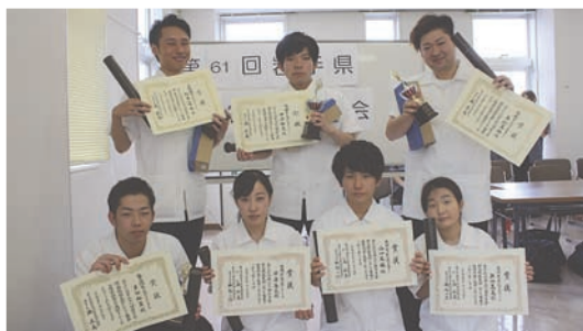
専門学校生の入賞者のみなさん