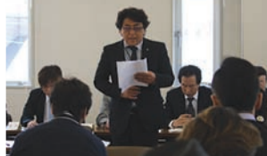
共済部加入促進優秀支部の皆さま