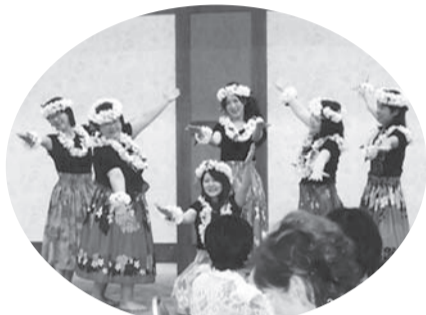
▲老人ホームへの訪問で日頃の練習の成果を披露する女性部