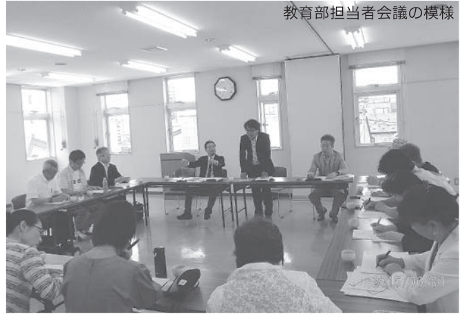
教育部担当者会議の様相