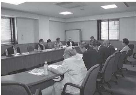
▲県生衛同組合の各地区の現状報告が話された

ベントとしての今後の議題となりました。尚公衆衛生講習会の大切さをまだ理解できていない組合員も多く指導センターとしては今年度から各地区ごとに必ず年に一度は生活衛生同業連絡協議会の会議を開催し組合員から沢山の意見を聞きたいとお話がありました。