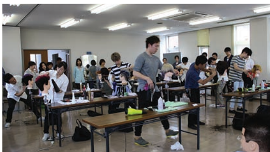
真剣に競技に取り組む選手たち